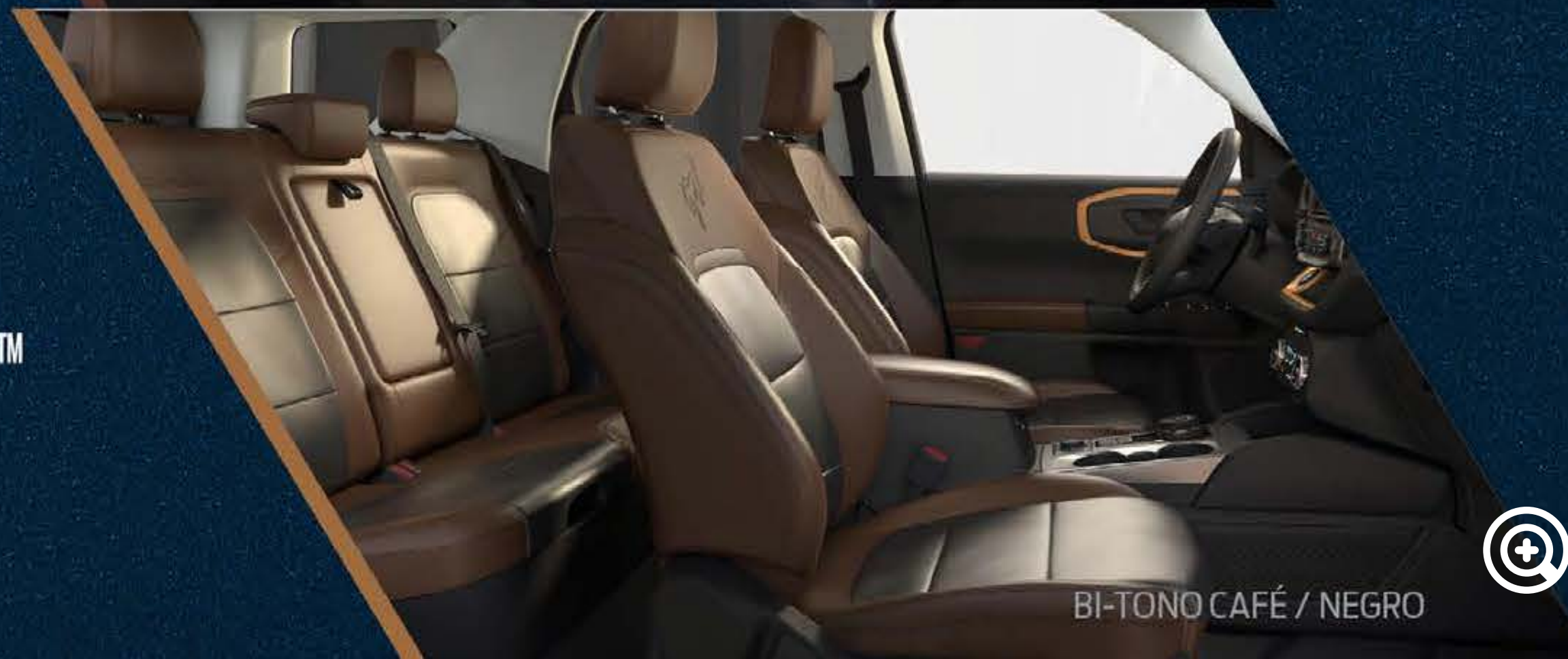
BI-TONO CAFÉ / NEGRO