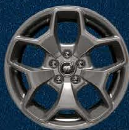
Rines Off-Road de Aluminio en Color Gris Carbono de 17"