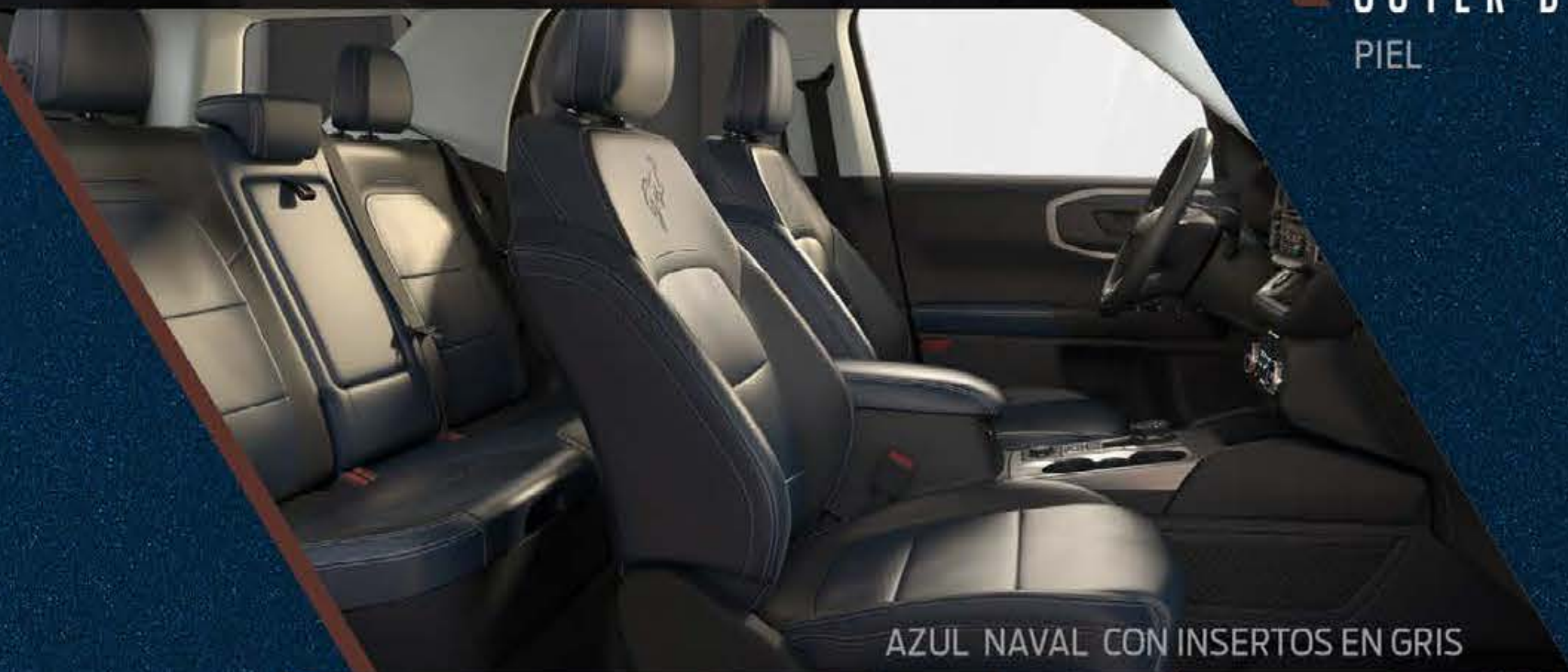
AZUL NAVAL CON INSERTOS EN GRIS