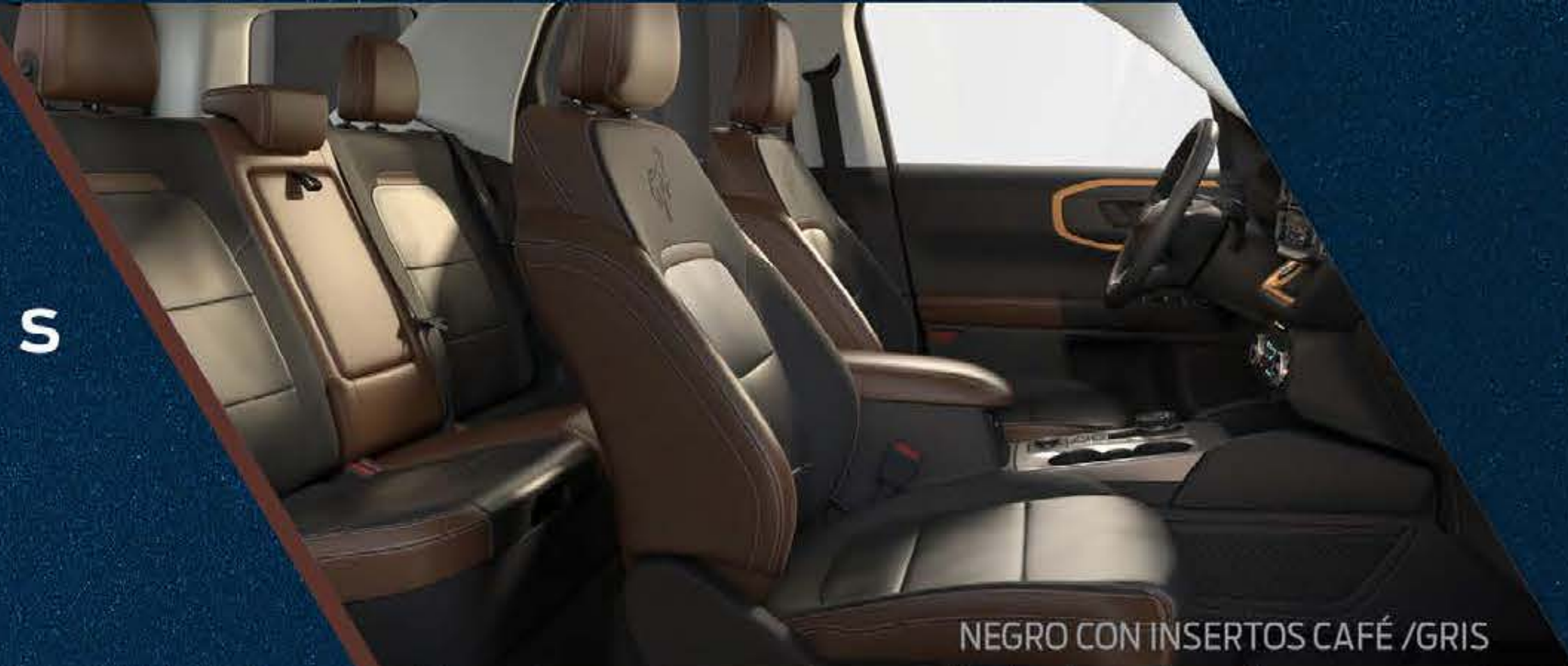
NEGRO CON INSERTOS CAFÉ /GRIS