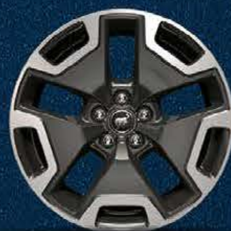
Rines Bi-Tono de Aluminio Cepillado de 18"