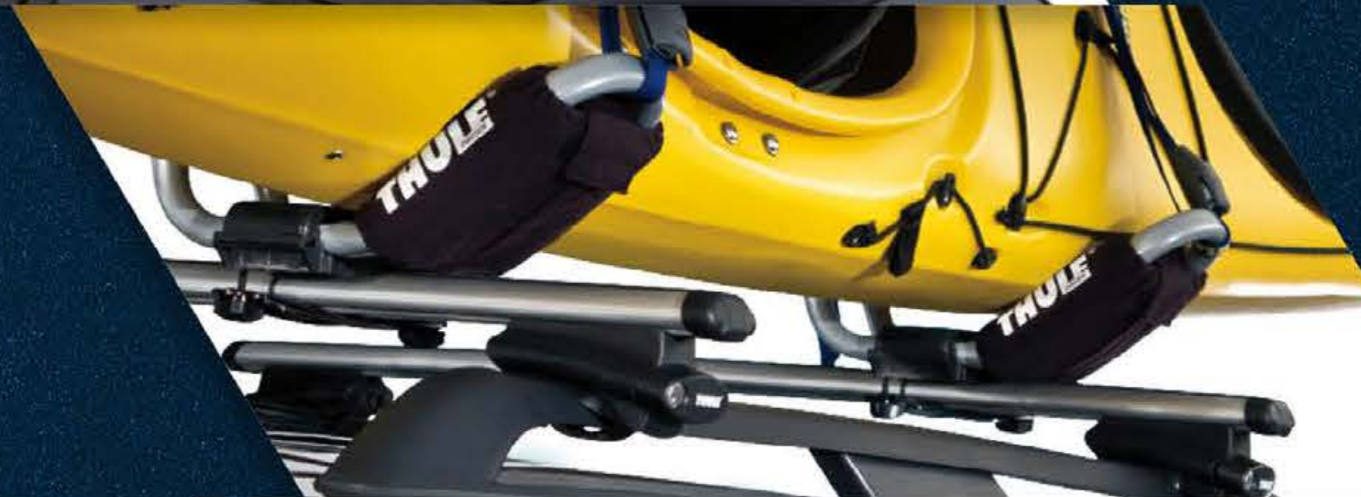
PORTA KAYAK DE TECHO