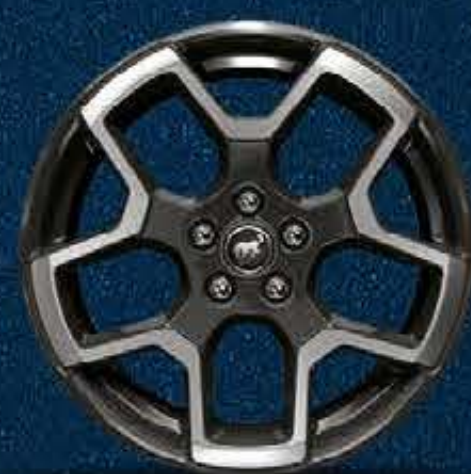
Rines Bi-Tono Negros de Aluminio Maquinado de 18"