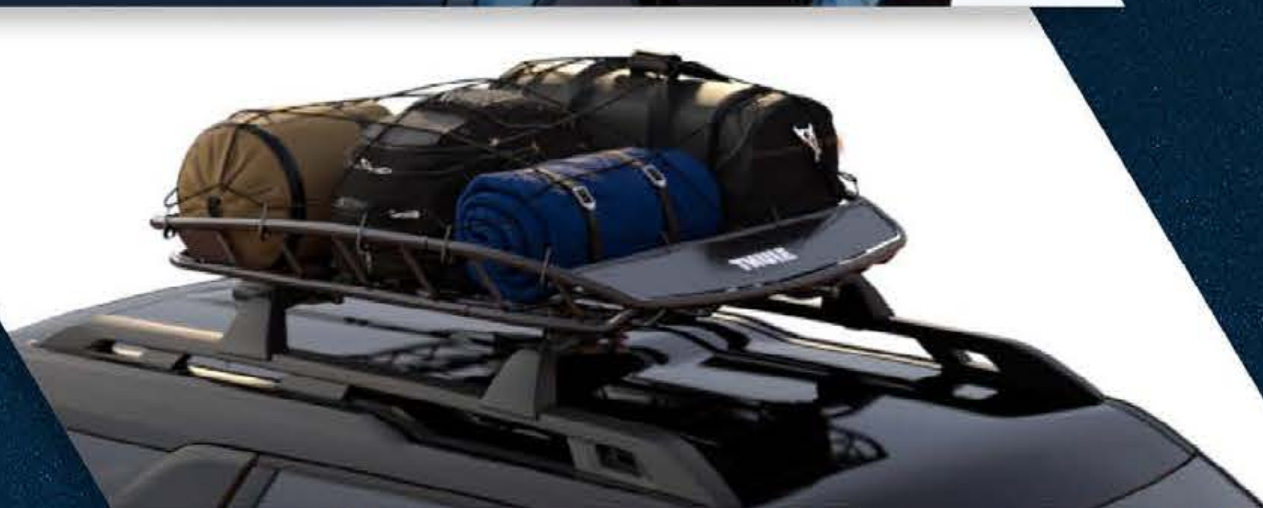
CANASTILLA DE CARGA