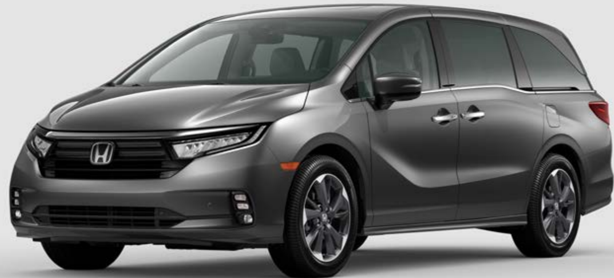
Odyssey Elite mostrada en Modern Steel Metallic | Odyssey Elite shown in Modern Steel Metallic