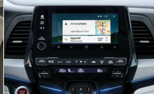
Odyssey Elite mostrada en Grey Leather | Odyssey Elite shown in Grey Leather

APLICACIÓN DE INTEGRACIÓN DE TELÉFONO INTELIGENTE PARA AUTO 2,3 Conecta tu Odyssey con tu teléfono inteligente compatible para acceder a direcciones, compromisos y hasta el estado del tiempo.