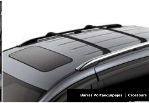
Barras Portaequipajes | Crossbars