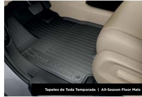
Tapetes de Toda Temporada | All-Season Floor Mats