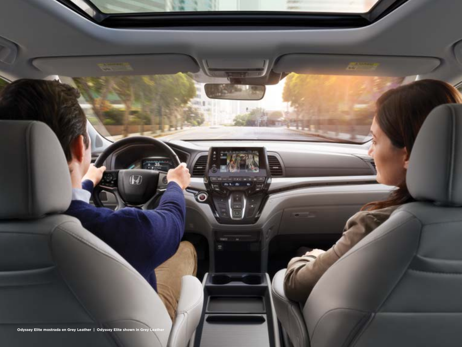
Odyssey Elite mostrada en Grey Leather | Odyssey Elite shown in Grey Leather