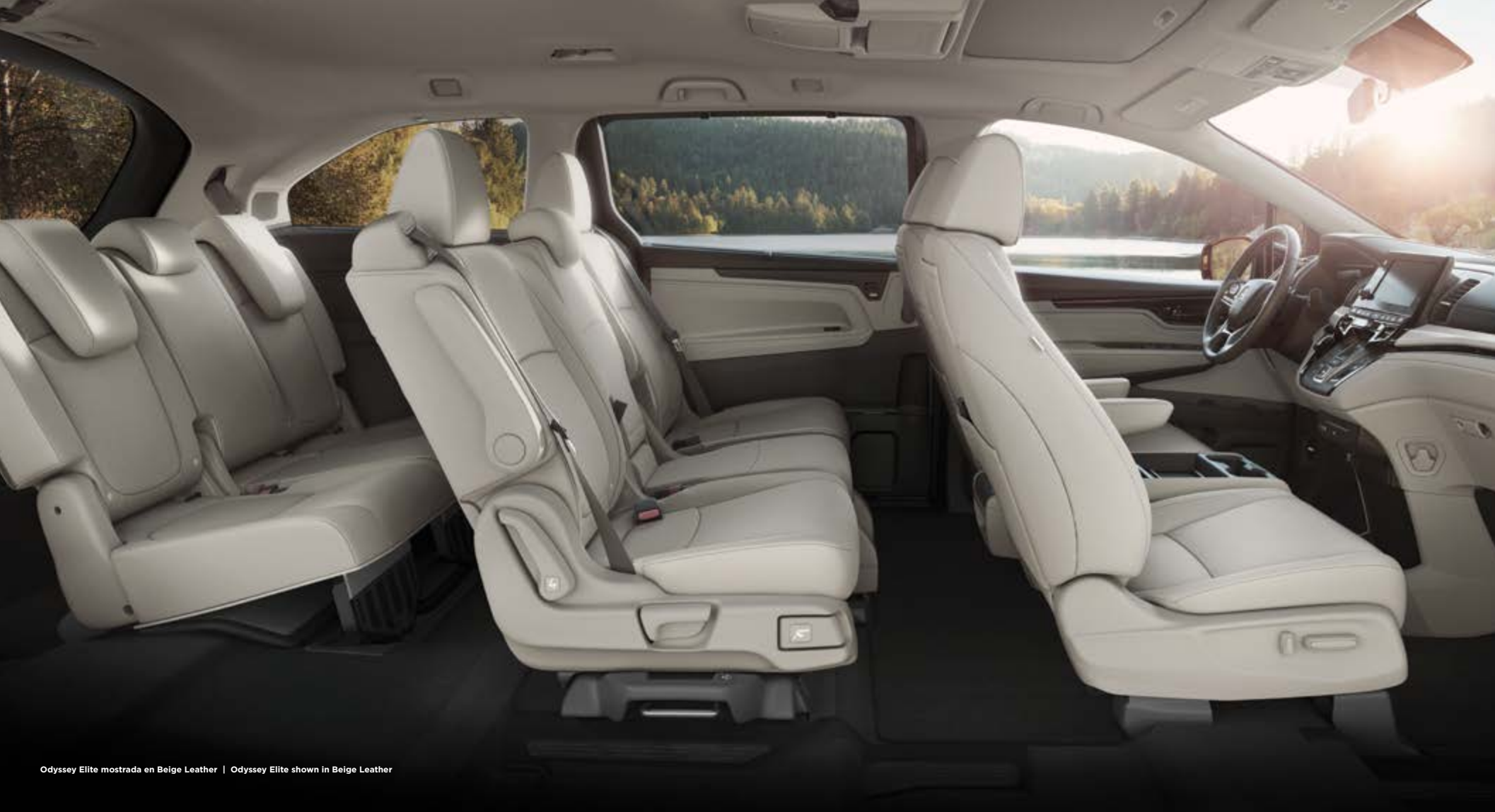
Odyssey Elite mostrada en Beige Leather | Odyssey Elite shown in Beige Leather