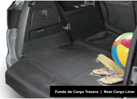
Funda de Carga Trasera | Rear Cargo Liner