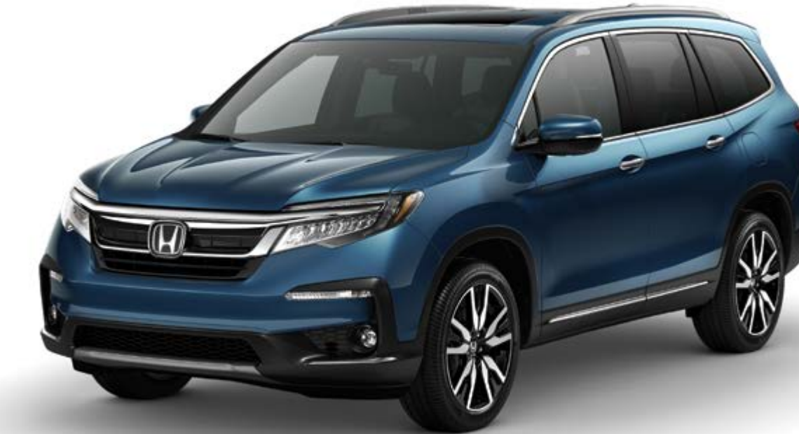
Pilot Elite mostrada en Steel Sapphire Metallic / Pilot Elite shown in Steel Sapphire Metallic